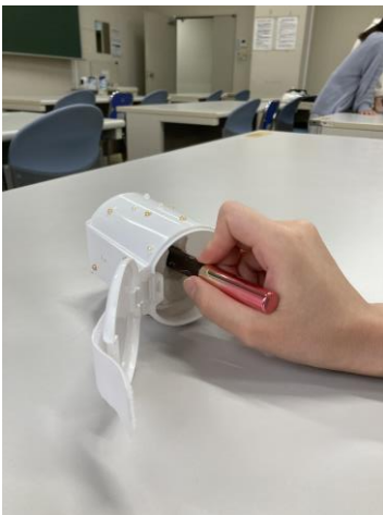
メイク道具を固定する